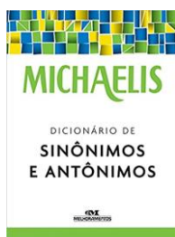
Dicionário de Sinônimos e Antônimos

Shel Silverstein /Companhia das Letrinhas